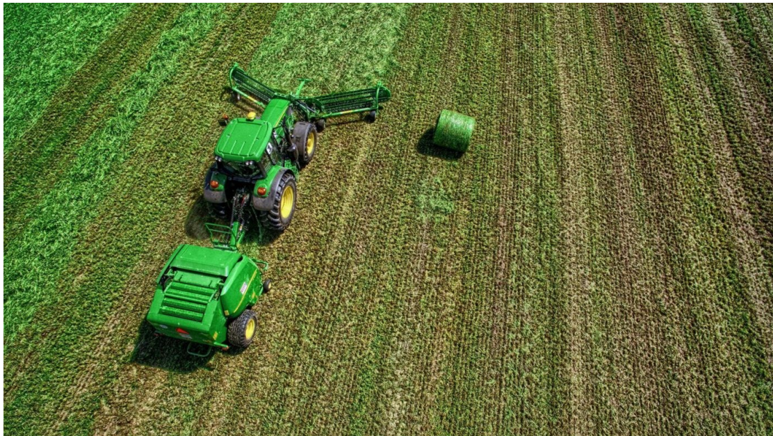
Bild 2: Kammschwader der Baureihe Twist von Samasz im Einsatz vor einer Rundballenpresse [22].

Samasz verfolgt die Weiterentwicklung der Kammschwader und stellt auf der Agritechnica 2023 den Twist 710 vor (vgl. Bild 2 ). Bei herkömmlichen Kreiselschwadern rotieren die Zinken in der horizontalen Ebene. Im Gegensatz dazu drehen sich die Zinken der Kammschwader in der vertikalen Ebene und reduzieren so laut Hersteller die Futtermittelverunreinigung, insbesondere durch Steine. Der Twist 710 weist eine Arbeitsbreite von 7,10 m bei einer Transportbreite von 2,50 m und Transporthöhe von 3,40 m auf und kann ab einer Traktorleistung von 60 kW eingesetzt werden.